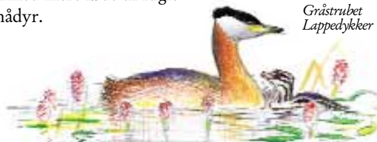
Gråstrubet Lappedykker Tegning af Jens Gregersen

Søen giver sammen med den tilstødende rørskov gode ynglemuligheder for flere arter af ænder, lappedykkere, vandhøns og sangere. Som det eneste sted på Fyn yngler både Toppet-, Gråstrubet-, Lille- og Sorthalet lappedykker. De afgræssede enge er desuden ynglested for Viben. Og måske kan Sundet igen blive voksested for orkideen Maj - Gøgeurt og andre af de mange planter, som forsvandt ved tørlægningen.