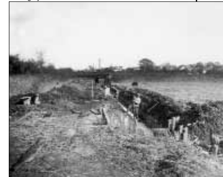
Tørlægning af Sundet i 1946