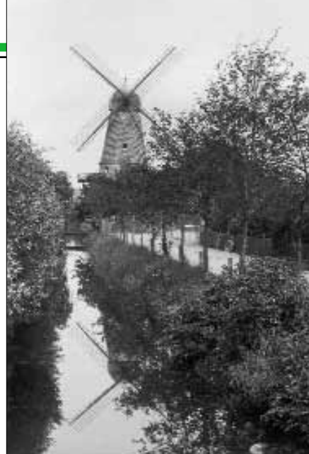
Sundmøllen der blev opført i 1881 og brændte i 1929